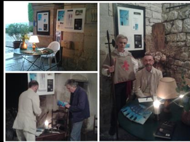
Hugues de Jubécourt a dédié son livre au Château de Cénevières